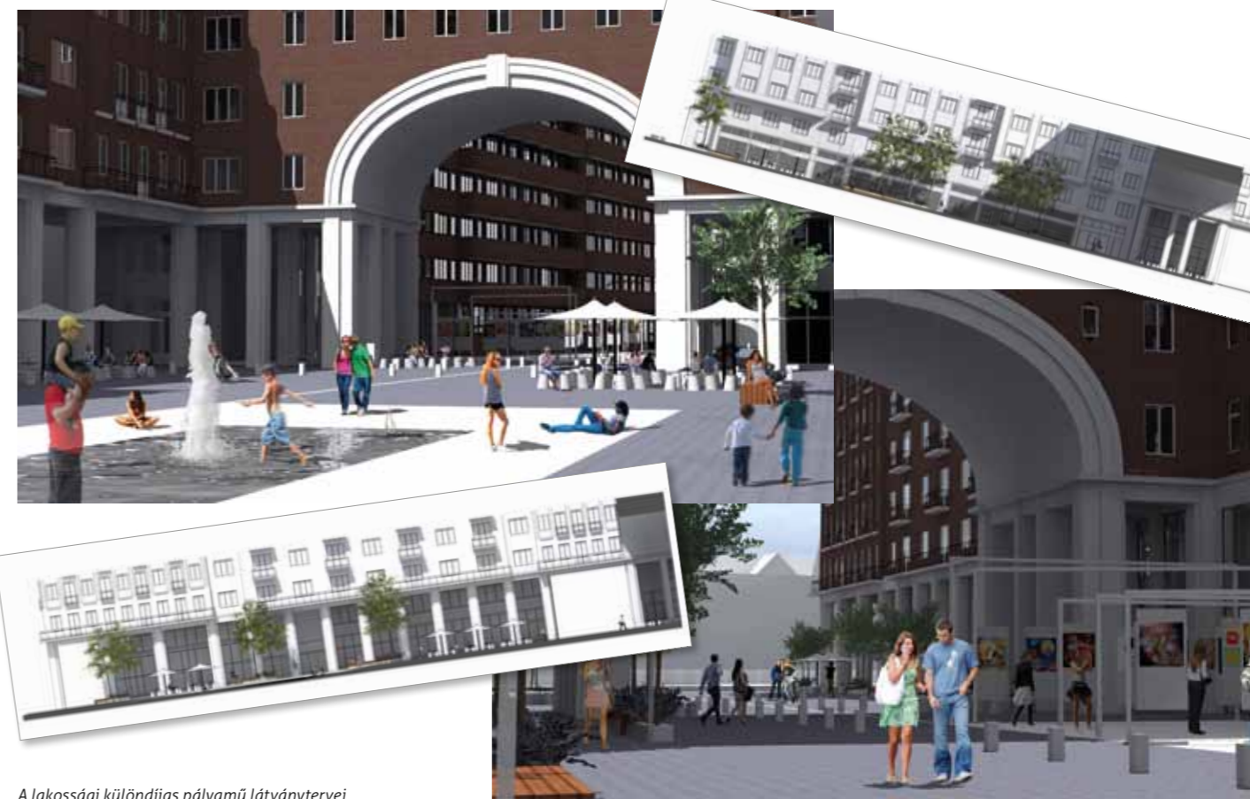
A lakossági különdíjas pályamű látványtervei

M.D.N.: Ha az egyetem mellett lesz időnk, akkor nagyon szívesen, hiszen ez egy remek kezdeményezés, mert így legalább több fiatal meg tudja mutatni terveit, akár egyénileg, akár csoportosan.