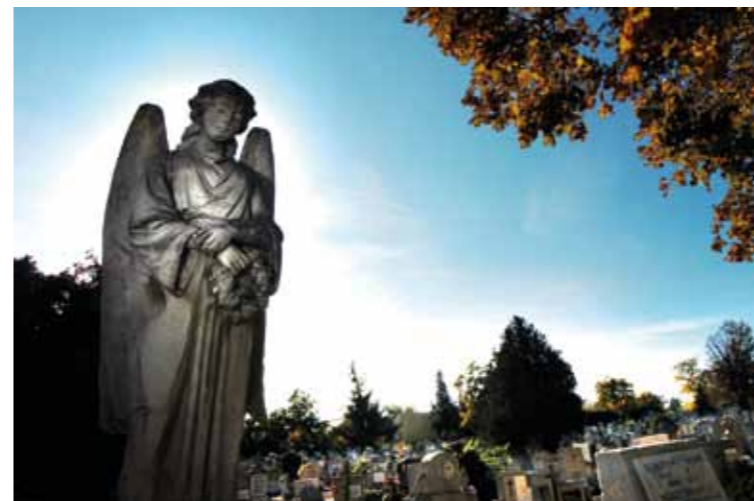
Hivatalosan a katolikus egyház vezette be az elhunytakról való megemlékezést

A különféle egyházak közül a katolikushoz hasonlóan az evangélikusok is tartják a halottak napját, a görögkatolikusok és a görögkeletiek többet is egy évben. Bár a reformátusok hivatalosan nem ünneplik, de gyakorta előfordul, hogy a református hívek is kilátogatnak ilyenkor a temetőkbe.