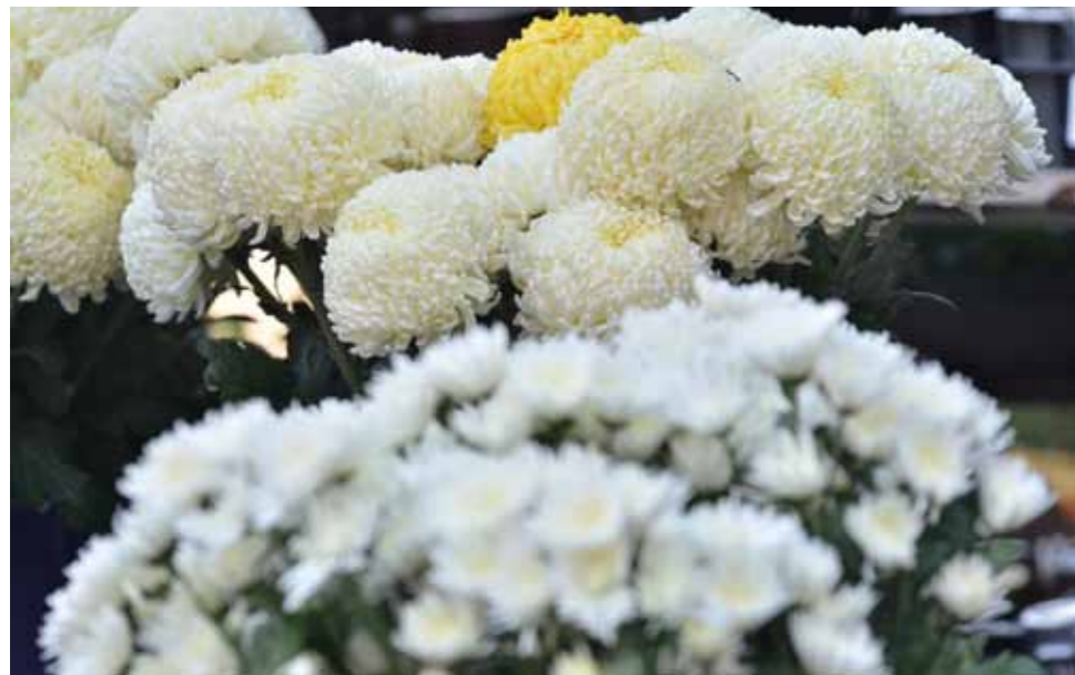
A krizantém Ázsiában a jólét jelképe

Érdekes, hogyan lett a krizantém a jólét jelképe, amely Ázsiában a jólét jelképe, Európában a temetők virága. Hazájában a sárga virág meghosszabbítja az életet, Japánban pedig a királyi ház jelvénye. Franciaországba a XVIII. században hozták dísznövényként.