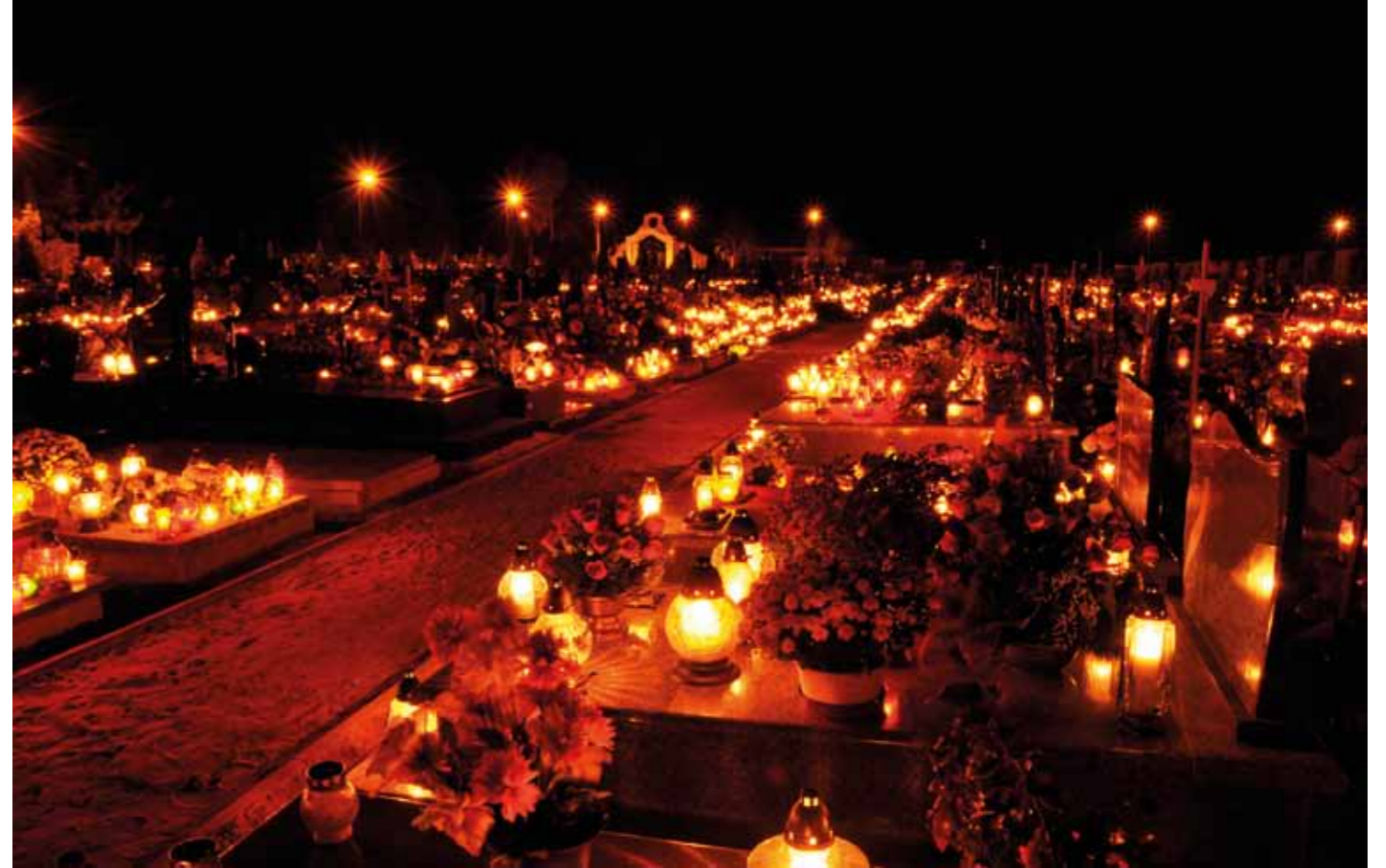
Az ünnep alatt mindenki megemlékezik szeretteiről, és gyertyafénybe borulnak a temetők

Az első világháború után azért lett a temetők virága, mert ez volt az egyetlen, amely még november elején is virágzott. Persze Európában sem mindenütt társítják a halálhoz, hiszen Hollandiában a menyasszonyi csokor része.