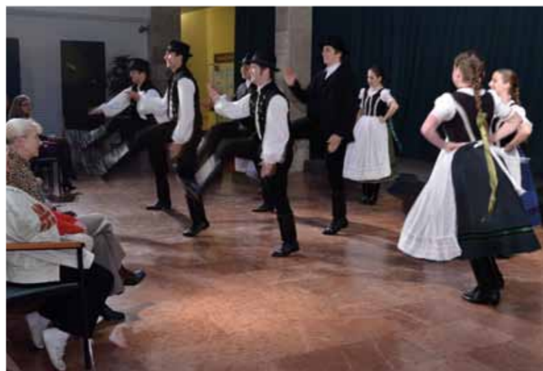
A Bihari Táncegyüttes műsorát is megtekinthették a zárórendezvényen

A zárórendezvényre, melyen az EVICA csoport és a Bihari Táncegyüttes is fellépett, október 24-én került sor.