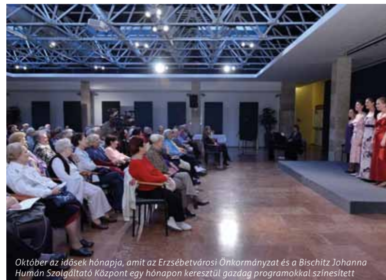
Október az idősek hónapja, amit az Erzsébetvárosi Önkormányzat és a Bischitz Johanna Humán Szolgáltató Központ egy hónapon keresztül gazdag programokkal színesített